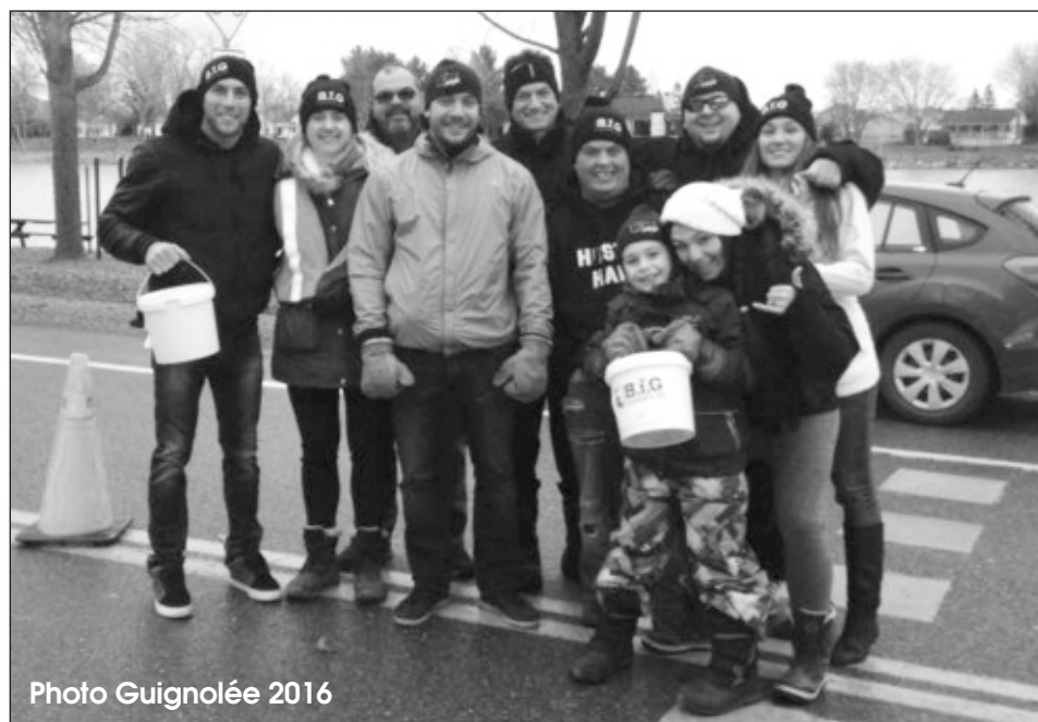
Photo Guignolée 2016

Votre comité organisateur de la Guignolée