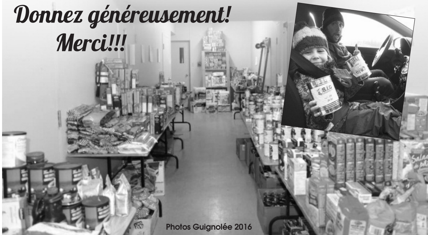
Photos Guignolée 2016