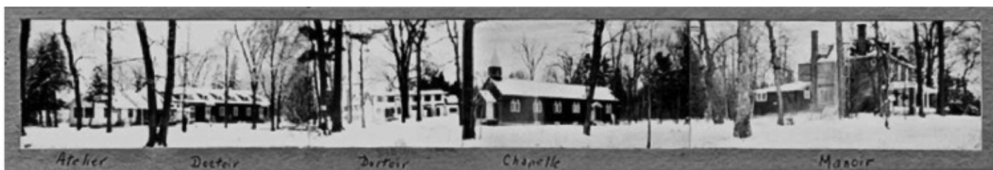
De gauche à droite, nous pouvons voir l'atelier tout près du dortoir des garçons, suivi de celui des filles. La suivante est la chapelle et vers la droite, plus près de la rivière, le manoir.