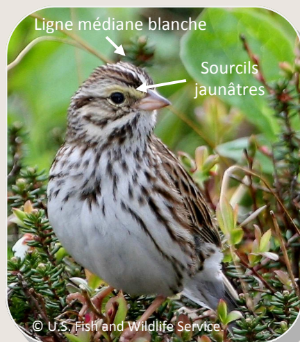
Bruant des prés