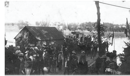
Le quai du village vers 1910

En 1926, la municipalité s'adresse au commissaire des incendies du Québec pour obtenir l'aide nécessaire afin de satisfaire aux recommandations de ce commissariat.