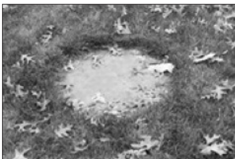
Couvercle mal dégagé.

Les vidanges auront lieu entre les dates du 22 juillet et du 21 août 2024. Les fosses des autres propriétés seront vidangées en 2025. La date exacte de votre vidange n'est pas disponible, car cela dépend du déroulement des activités lors des vidanges.